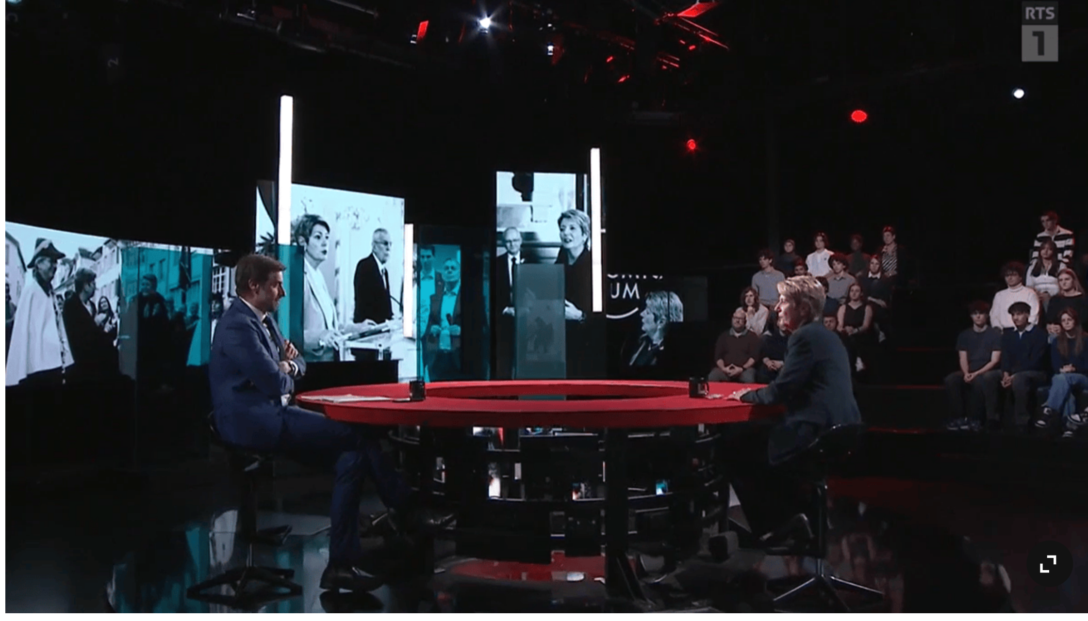
Am Mittwochabend nahm Karin Keller-Sutter in der Sendung RTS Stellung zu ihren Aussagen zu J. D. Vance.

Jetzt abonnieren und von der Vorlesefunktion profitieren.